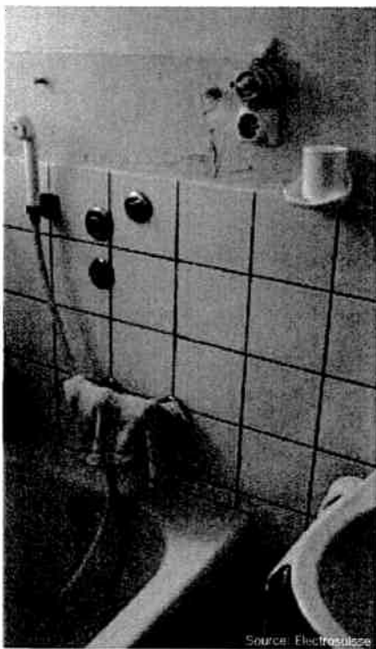
Cette prise de courant n'est pas conforme aux prescriptions de l'OIBT (la distance de la baignoire doit être d'au moins 70 cm)